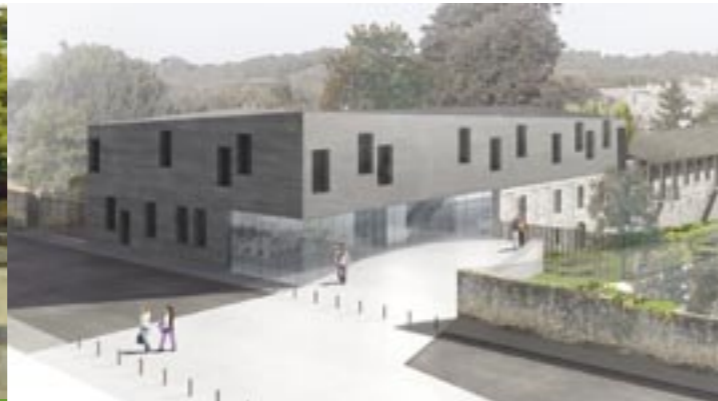
Ci-dessus les locaux actuels du siège de la CDC et à droite le projet architectural du cabinet d'architectes Bordelais King-Kong, retenu par le jury de concours.