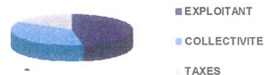
Répartition des montants collectés

Sur ce montant, 47 % reviennent à l'exploitant pour l'entretien et le fonctionnement, 36 % reviennent à la collectivité pour les investissements et les taxes s'élèvent à 17 %.